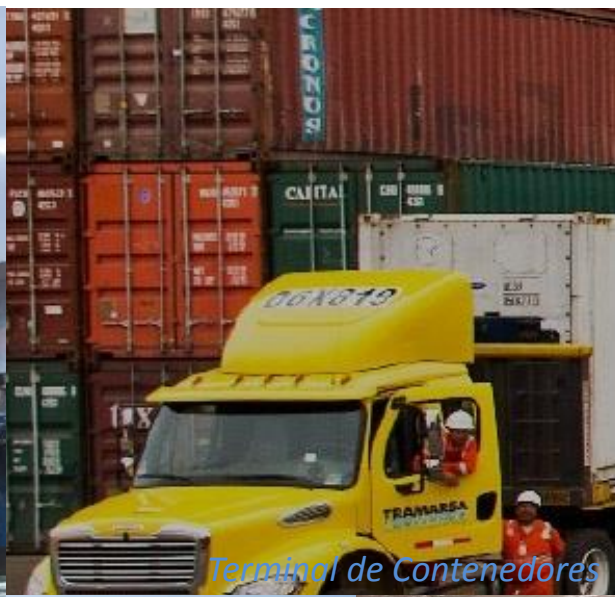
Terminal de Contenedores