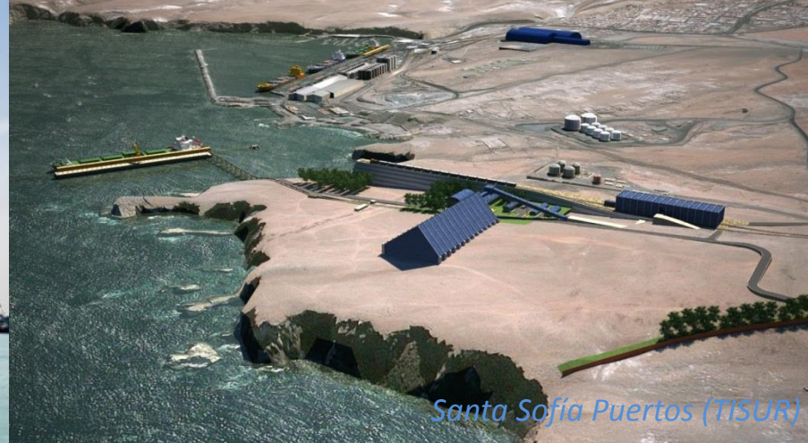
Santa Sofía Puertos (TISUR)