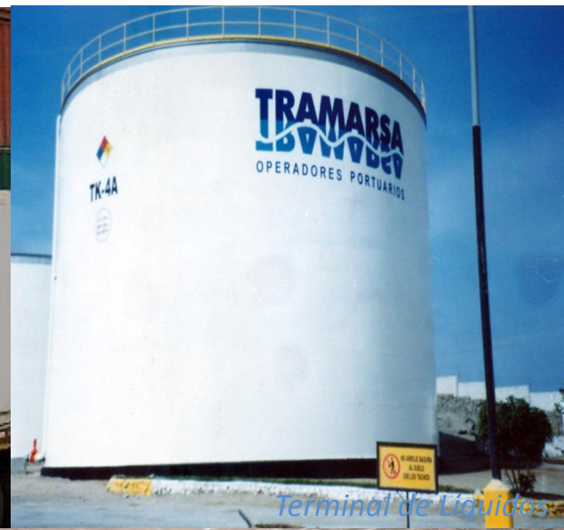
Terminal de Líquidos